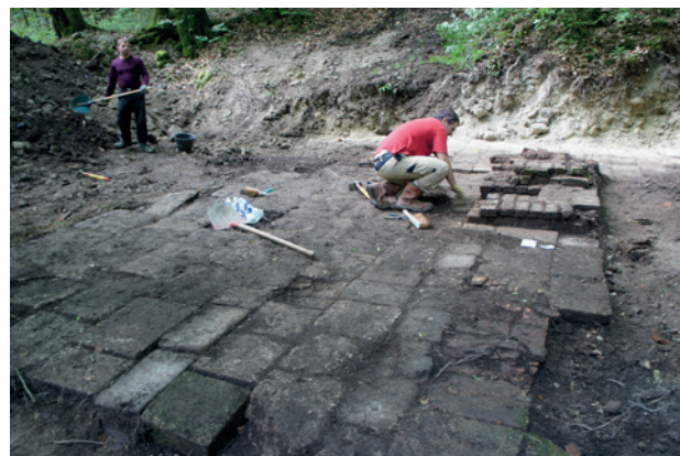
Sol et four de l'étuve en cours de fouille, cantonnement allemand du Borrieswalde, Apremont, Ardennes

Il s'agit d'une des premières fouilles programmées concernant le passé récent en France. Ces recherches ont permis d'étudier l'organisation spatiale d'un camp en fonction en Argonne de 1916 à 1918, et d'en reconnaître les différentes composantes : cuisines, mess, antenne médicale, douches, latrines... De ces différentes structures sont issues un abandon matériel liés au fonctionnement du camp. Tous les camps situés dans les plaines de Flandres, d'Artois et Picardie ont maintenant disparu, ce qui renforce l'intérêt des camps mis au jour dans les forêts d'Argonne.