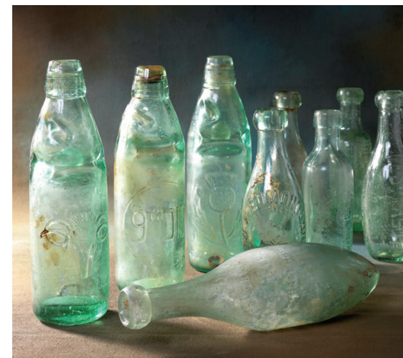
Bouteilles britanniques en verre

Pendant ces années, il a fallu assurer une distribution régulière de vivres. Ce défi logistique a notamment été relevé par les Britanniques, qui ont réussi à faire transiter par les ports français trois millions deux-cent quarante mille tonnes de marchandises pour nourrir quotidiennement cinq millions trois cent soixante mille hommes. Les recherches menées sur les lieux où ont séjourné les soldats révèlent toujours une quantité importante de matériel, qui vient compléter utilement les documents d'archives sur cet aspect de la vie quotidienne des différents belligérants. Ces données nous ont permis de lancer des études sur les pratiques alimentaires, de reconnaître les différents circuits d'approvisionnement du local à l'international. Elles nous renseignent également sur l'adoption de régimes alimentaires différents, en fonction des nationalités, des religions, voire des origines régionales des régiments. Il faut produire 80 tonnes de matériel par an et par combattant. Les produits consommés pendant la Grande Guerre sont toujours consommés aujourd'hui (par exemple Perrier et Schweppes)