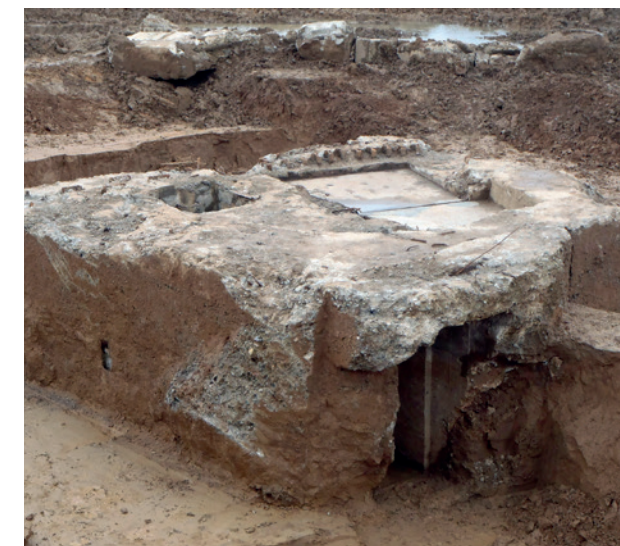
Abri français fouillé sur le site de Presles-et-Boves Moulin de Laffaux

Le 16 avril 1917, cette partie du front est choisie par l'Etat-major français pour lancer une grande offensive. Au bout d'une semaine de combats, les gains de terrain sont minimes et les pertes élevées, s'élevant à 130 000 hommes, dont 30 000 tués. De juin à juillet, de violents combats ont lieu pour le contrôle des points hauts du plateau. Après une pause, une offensive ciblée sur le fort de La Malmaison est entreprise en octobre 1917. La victoire française contraint les Allemands à se replier dans la vallée de l'Ailette. Au printemps 1918, les armées allemandes relancent des offensives de grande envergure et le Chemin des Dames est conquis et dépassé en une journée de fin mai. Les contre-offensives victorieuses des Français en juillet 1918 viendront encore buter sur cette forteresse naturelle.