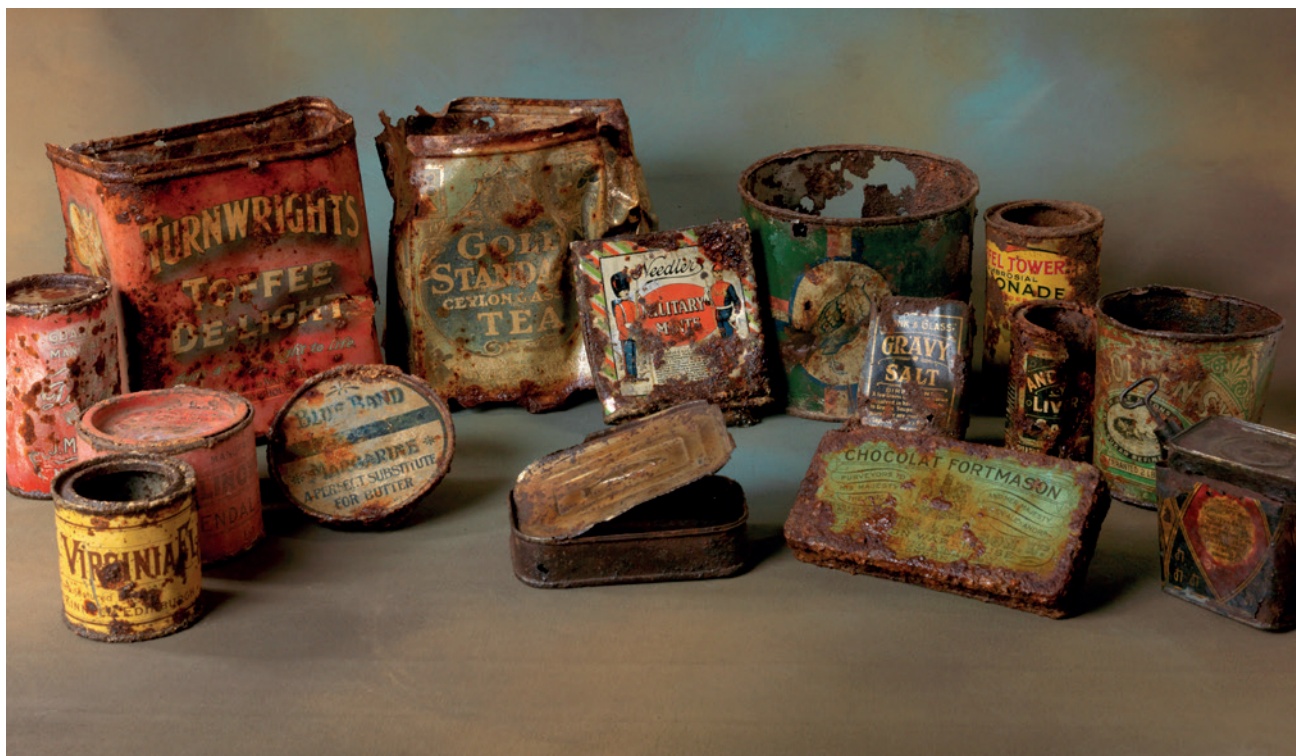
Boîtes de conserve